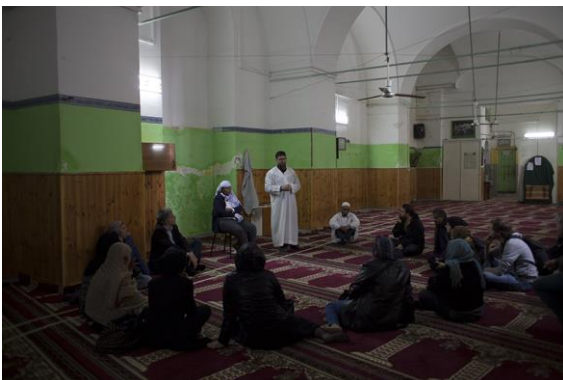
Una tappa è la visita alla moschea di Piazza Mercato

luogo di ritrovo Piazza Mercato durata 2 h