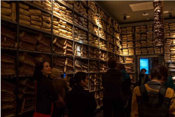
La tappa all'Archivio storico del Banco di Napoli

Da Officine Gomitoli a Il Cartastorie / museo dell'Archivio Storico del Banco di Napoli , passando per Avventura di Latta e la chiesa ucraina di rito bizantino, fino al centro di accoglienza di Less Onlus .