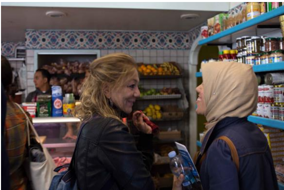
La prima macelleria "halal", lecita, aperta in città

luogo di ritrovo Piazza Garibaldi sotto il monumento di Garibaldi durata 2 h